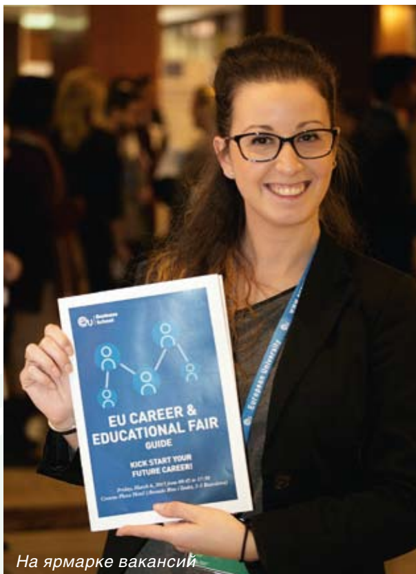
На ярмарке вакансий

выпускников не возникает проблем с трудоустройством, тем более, что карьерная служба EU оказывает им в этом вопросе реальную помощь в виде выдачи рекомендаций, оптимального подбора вакансий в специальных центрах планирования карьеры. Кроме того, ежегодно EU организует ярмарки вакансий, где студенты и выпускники могут пройти собеседование во всемирно известных рекрутинговых компаниях.