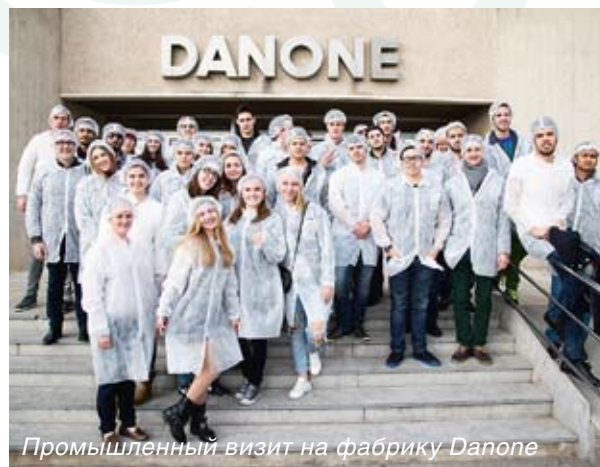
Промышленный визит на фабрику Danone