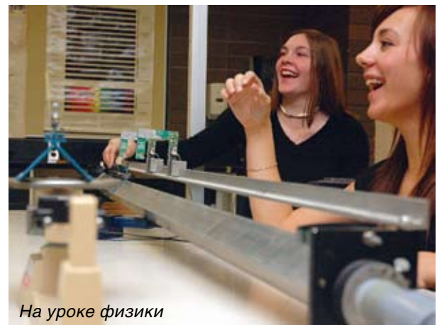
На уроке физики

дит для своих студентов) научила меня, как правильно подбирать людей для выполнения того или иного задания, а ещё я научился уважать культуру людей из разных стран мира».