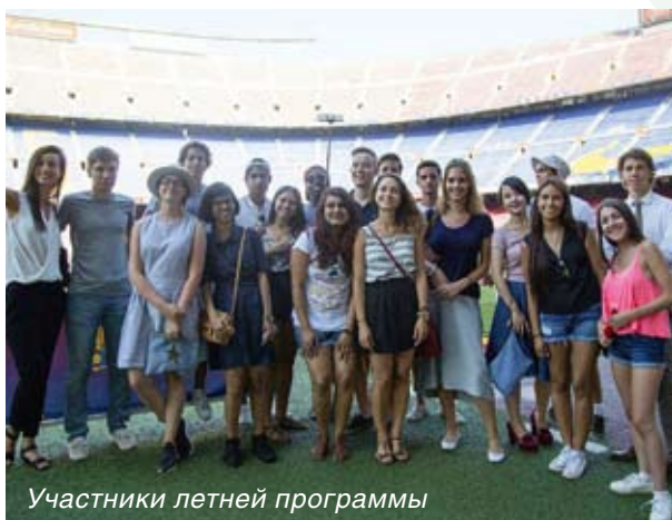
Участники летней программы

Также качество программ бизнес-школы высоко оценивается сетью государственных учреждений Central & East European Management Development Association (CEEMAN), по стандартам которой строятся все современные системы образования в странах Европы. В этой ассоциации EU имеет официальную аккредитацию.