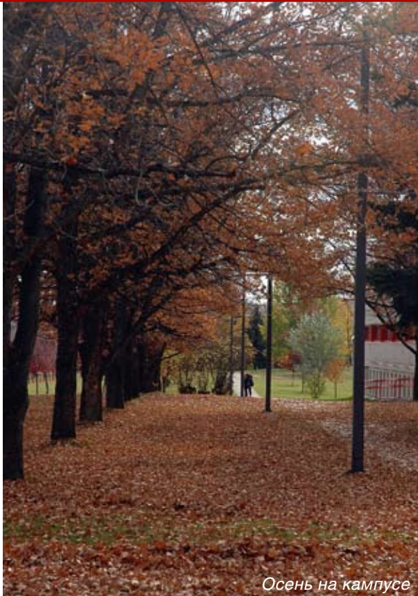
Осень на кампусе

таких постдипломных программ с успехом находят работу как в Британской Колумбии, так и в других регионах Канады.