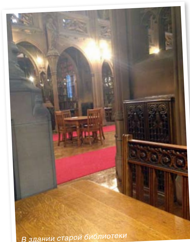
В здании старой библиотеки