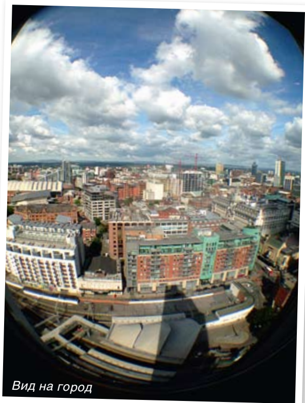
Вид на город

Мне очень нравится общаться с разными людьми и сравнивать, как они относятся к жизни. Я очень рад, что у меня появилось много знакомых из совершенно раз-