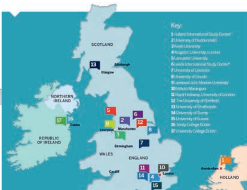
Карта вузов Великобритании и Европы

В Австралии и Новой Зеландии иностранным студентам доступны программы подготовки на кампусах вузов с дальнейшим зачислением в лучшие университеты в самых популярных городах, а также стипендии и скидки и возможность легально трудоустроиться!