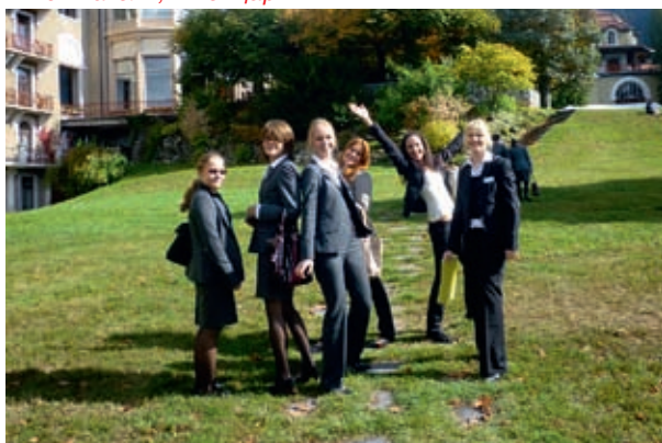
Международный форум работодателей, г. Монтрё, Швейцария