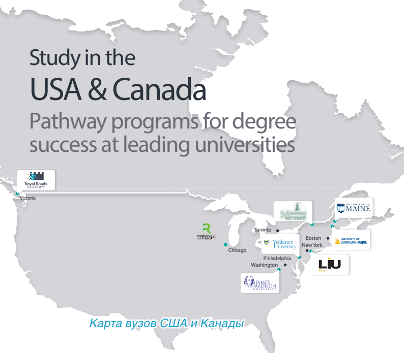
Карта вузов США и Канады