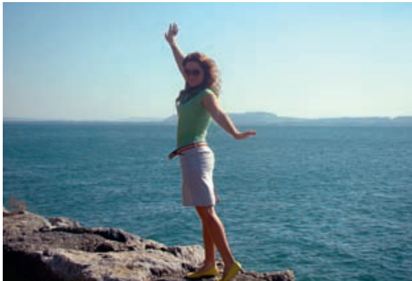
Прогулка по озеру, г. Невшаталь

Вторая: регулярные письменные отчёты о проделанной работе-практике, ежемесячные контрольные тесты, индивидуальные и групповые проекты-презентации.