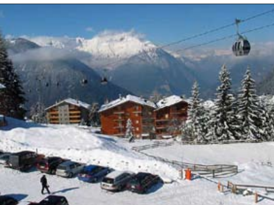
Лыжный курорт Вербье в Альпах