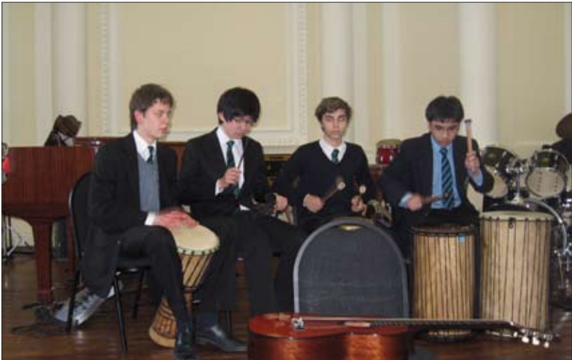
Школа-пансион Prior Park (г. Бат, Англия)