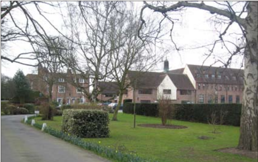
Средняя школа-пансион Junior Kings (г. Кентербери, Англия)