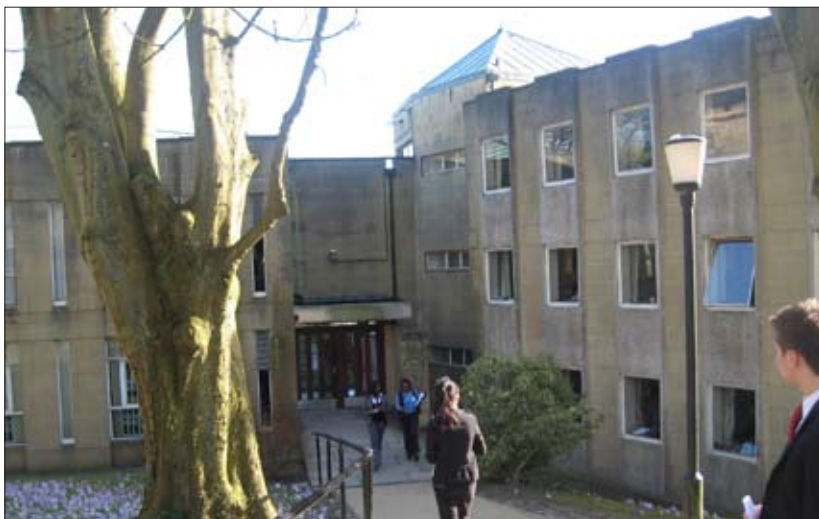
Средняя школа-пансион Kingswood (г. Бат, Англия)