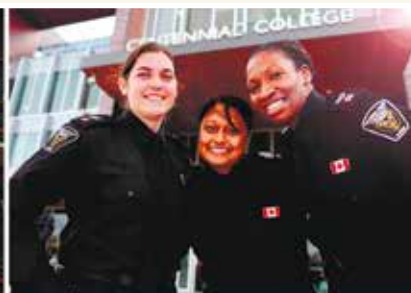
School of Community and Health Studies