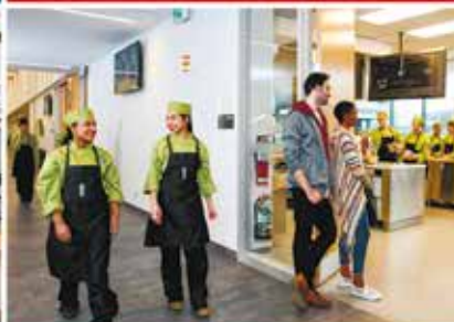
School of Hospitality, Tourism and Culinary