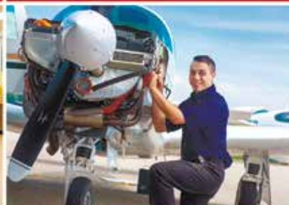
School of Transportation