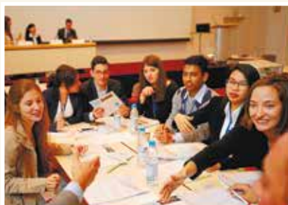
The Business School