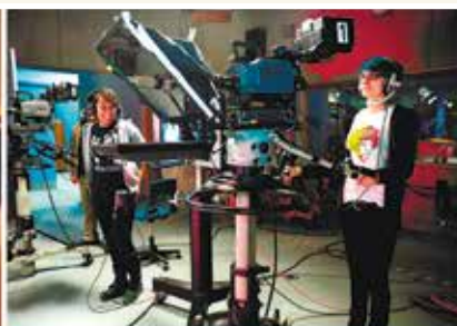
School of Communications, Media, Arts and Design