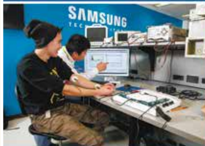
School of Engineering, Technology and Applied Science